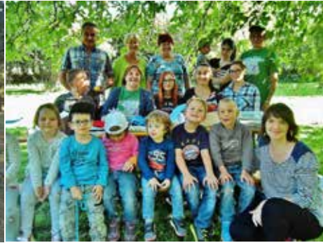
Gemeinsamer Spielenachmittag Heilpädagogisches Zentrum und Obst- und Gartenbauverein Pfaffendorf