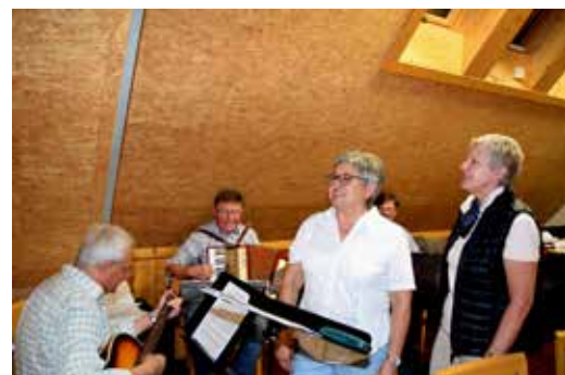
„Wäddshaussinga“ in der Scheune in Pfaffendorf Kulturverein Altenkunstadt