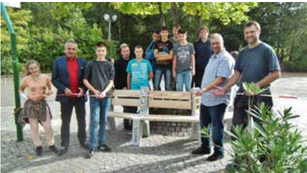
Neue Sitzgruppe in der Mittelschule Projekt Pausenhof