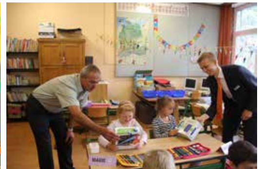
Spende der Raiffeisenbank Obermain Nord eG Brotzeitdose und Trinkflasche für jeden Erstklässler