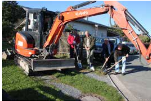
Spatenstich Baumgartenstraße Strössendorf