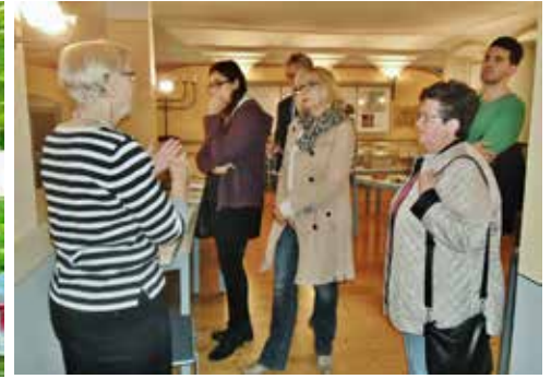
Museumsnacht in der ehem. Synagoge