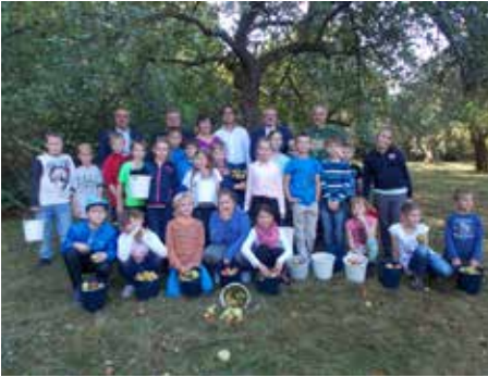
Apfelsammelaktion in der Grundschule mit der Raiffeisenbank Obermain Nord eG