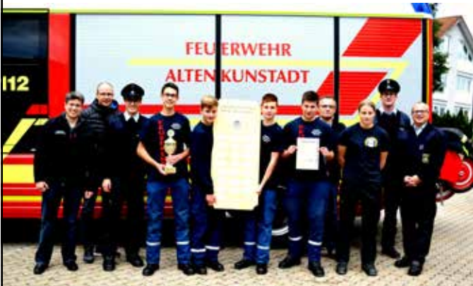
Sieger im Bezirksjugendleistungsmarsch Feuerwehrjugendgruppe Altenkunstadt