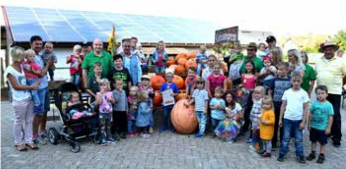
Kürbisfest in Baiersdorf Obst- und Gartenbauverein Baiersdorf