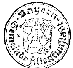
Robert Hümmer Erster Bürgermeister