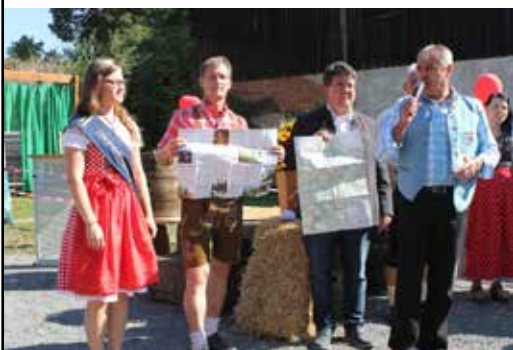
Gemeinsame Wanderkarte – Traumhafte Pfade