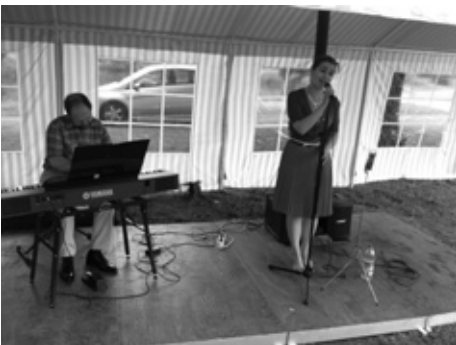
Der Kulturverein präsentiert: „Wenn die Stimme swingt“