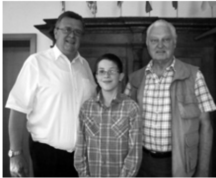
Drei Geburtstagsjubilare am 23.07.2012, die zusammen 150 Jahre alt sind