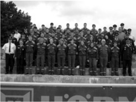
Ablegung der Jugendleistungsspange bei der Feuerwehr