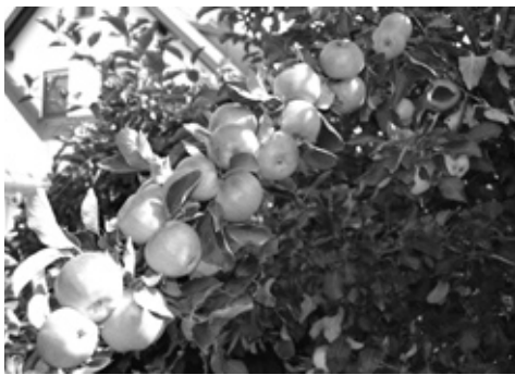
Reiche Apfelernte in Altenkunstadt