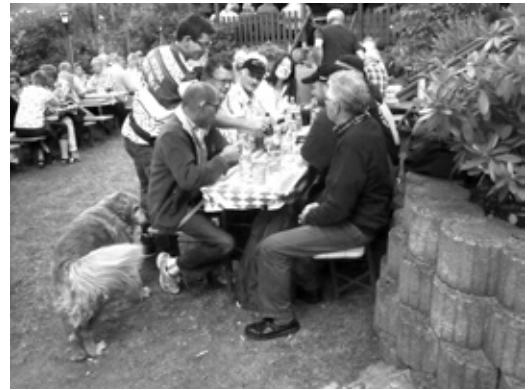
Bergfest RV Viktoria Maineck