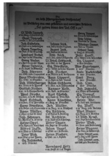
Sanierung der Ehrentafel an der Strössendorfer Kirche