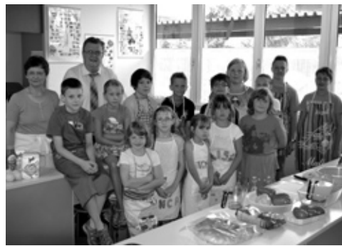
Kochkurs des Jugend-Sommerferien-Programms in der Mittelschule