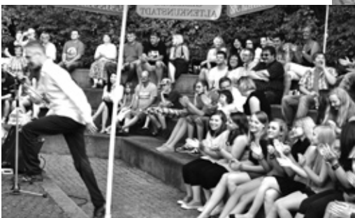
Open Air Veranstaltung