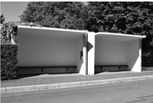
Frisch gestrichene Buswartehäuschen in Baidersdorf und Maineck