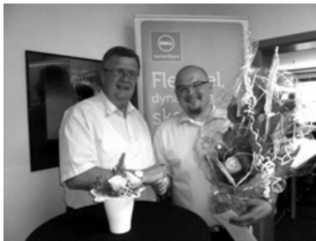
Wir begrüßen herzlich die Fa. Wolkenstein IT works