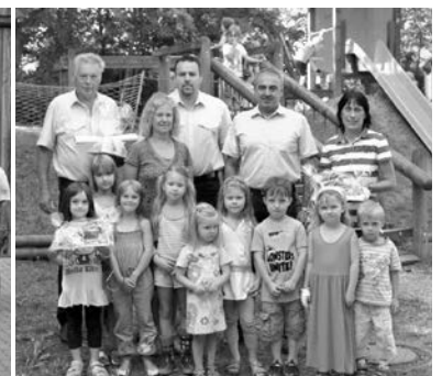
Spende der FF Woffendorf für unsere beiden KITA's