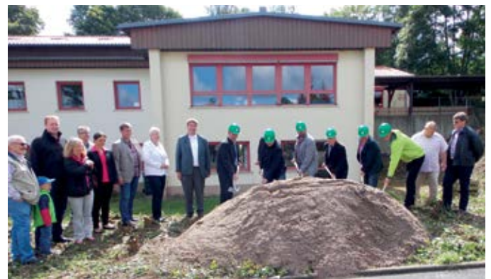
Spatenstich Kinderkrippe in der Kreuzberg-Kita

Für mich gilt weiterhin der Grundsatz des sparsamen Wirtschaftens.