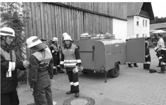
Leistungsabzeichen FF Zeublitz