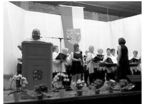
90 Jahre Singgemeinschaft Altenkunstadt