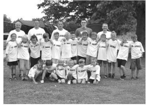
Nachwuchsfußballer aus Altenkunstadt, Baiersdorf und Woffendorf beim Jugendzeltlager