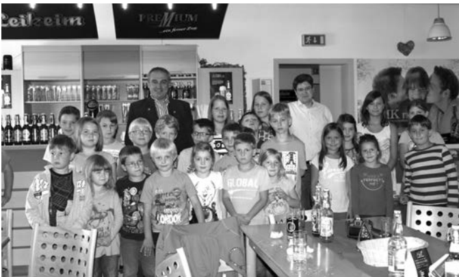
Jugend-Sommerferien-Programm Limoprobe bei der Brauerei Leikeim

Wir bieten auch in diesem Jahr wieder ein reichhaltiges Jugend-Sommerferien-Programm und freuen uns, dass viele Kinder und Jugendliche die vielseitigen Angebote auch wahrnehmen.