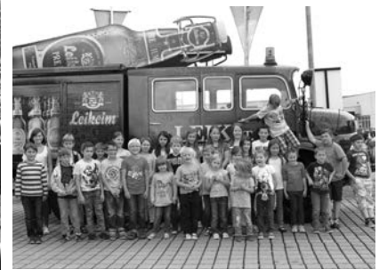
Jugend-Sommerferien-Programm Limoprobe bei der Brauerei Leikeim