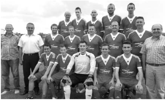
Erste Herrenmannschaft des FC Altenkunstadt-Woffendorf