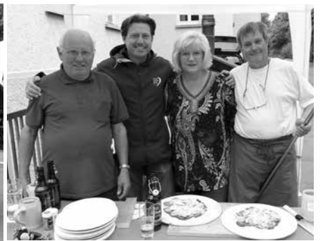
Jugendsommerferienprogramm Zimmerstutzen-Schützengesellschaft Altenkunstadt