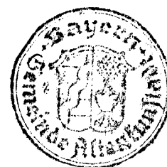
Robert Hümmer Erster Bürgermeister