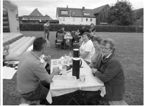
Spielmobil in Maineck