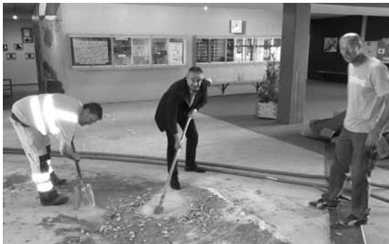
Erneuerung des Bodenbelages Aula Mittelschule