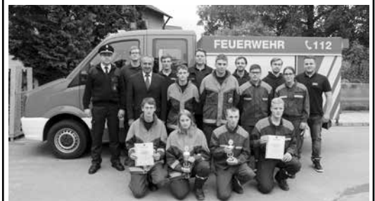
Kreisjugendfeuerwehrleistungsmarsch Jugendgruppe Altenkunstadt 2. Platz Jugendgruppe Burkheim 7. Platz