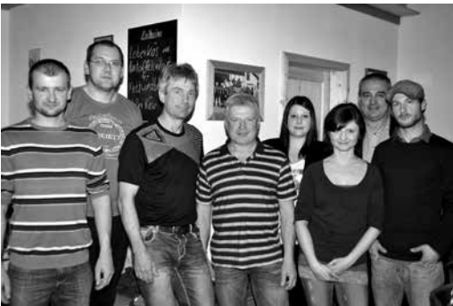
Jahreshauptversammlung Bürgerverein Spießberg