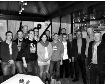
Jahreshauptversammlung FC Altenkunstadt