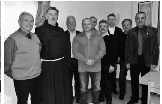
Vorstandschaft Casino Altenkunstadt