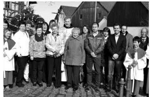
Jubelkommunion in Mainneck