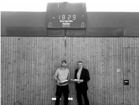
Neue Uhr-Anzeigetafel in der Kordigasthalle