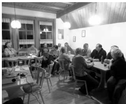
Bürgergespräch in Zeublitz/Treibitzmühle