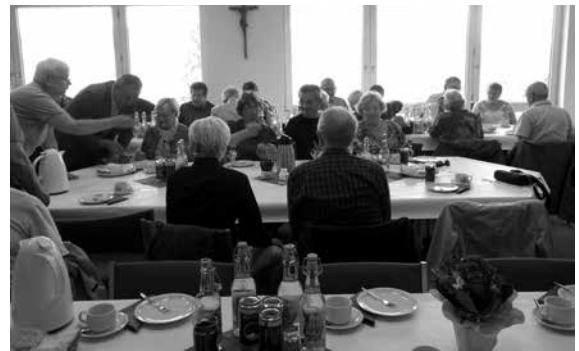
Besuch aus unserer französischen Partnerstadt Quéven im Rathaus Altenkunstadt