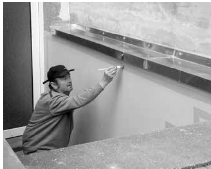
Eingang Rathauskeller, neuer Putz und Farbe durch unsere Bauhofmitarbeiter