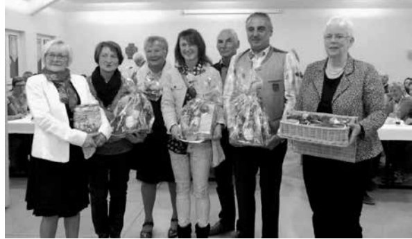
Deutsch-französischer Abend im kath. Pfarrheim