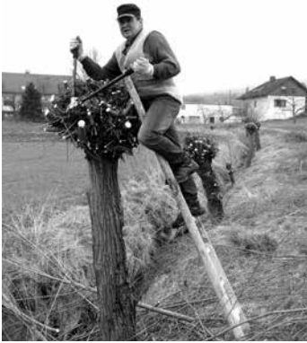
Kopfweidenpflege in Baidersdorf