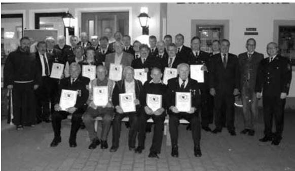
Ehrungsabend FFW Burkheim