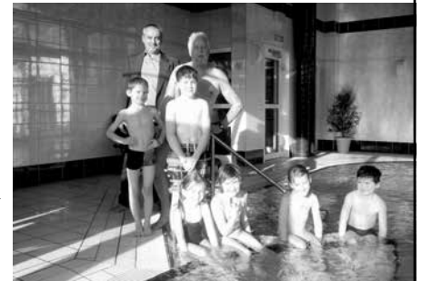
Schwimmkurs in Baiersdorf