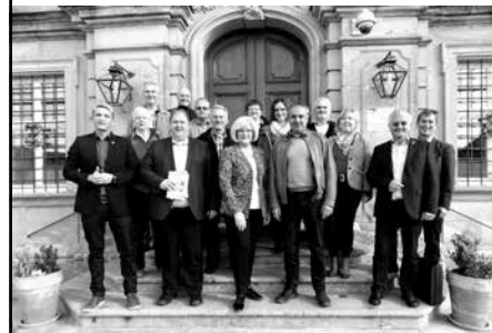
Zukunftswerkstatt Klausurtagung des Gemeinderates in Schloss Banz