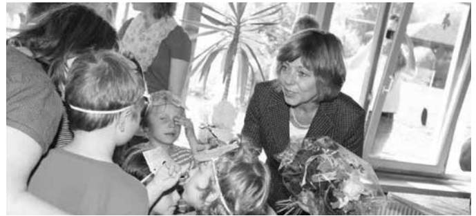
Schirmherrin Daniela Schadt besucht die Mutter-Kind-Kurklinik Loßburg

„Mama soll gesund sein!“, diesen Wunsch höre ich sehr oft, wenn ich mit Kindern in einer Mutter-Kind-Klinik spreche. Diesen Kindern ist völlig klar, dass nicht Spielzeug ihnen Geborgenheit und Wärme gibt, sondern ihre Mutter – und zwar nur dann, wenn sie gesund ist.