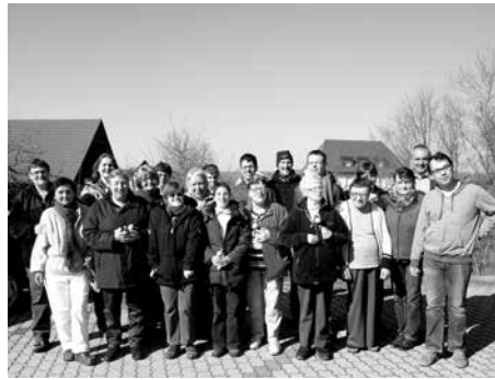
Regens Wagner-Außenwohngruppe Lisa und Felix besuchen den Bürgermeister