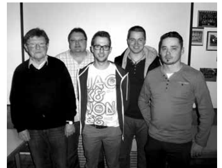
Neu gewählte Vorstandschaft des FC Baiersdorf