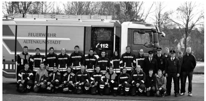
Abnahme Leistungsabzeichen FFW Altenkunstadt