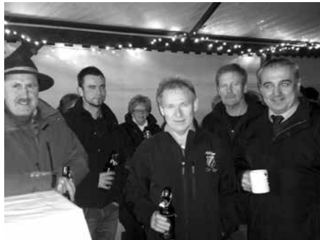
Wintersonnwendfeuer FFW Baiersdorf