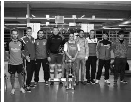
Hallenturnier 1. FC Baiersdorf