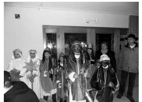
Jahreshauptversammlung 1. FC Woffendorf