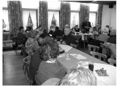
VdK Ortsverband Burkheim