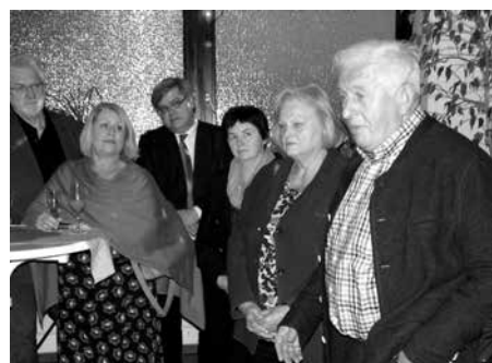
Eröffnung gemeinsamer Jugendtreff