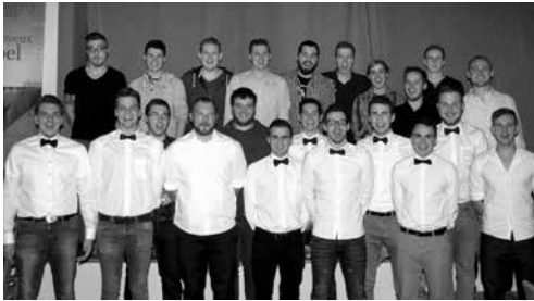
1. FC Altenkunstadt/1. FC Woffendorf