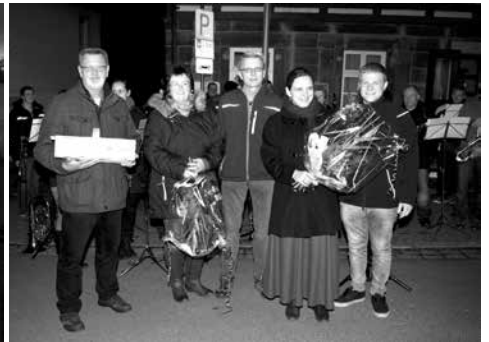
Musikverein Altenkunstadt spielt Weihnachtliche Weisen vor dem Rathaus