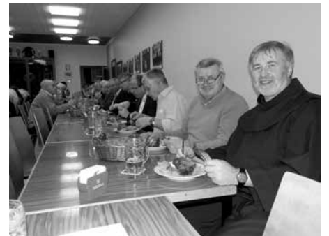
Jahreshauptversammlung FFW Altenkunstadt