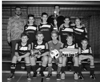
Hairkiller-Cup D1-Jugend 1. FC Altenkunstadt