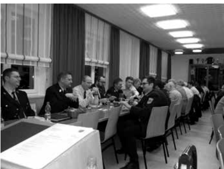
Jahreshauptversammlung FFW Altenkunstadt