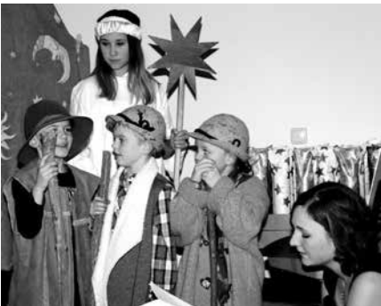
RV Concordia Altenkunstadt