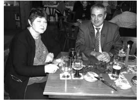
Obst- und Gartenbauverein Baiersdorf