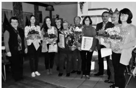
Jahreshauptversammlung mit Ehrungen Gartenbauverein Burkheim