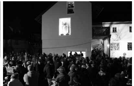
Vorglühen in der „Hölle“ - Historische Stadtführung in Weismain Kommunale Zusammenarbeit