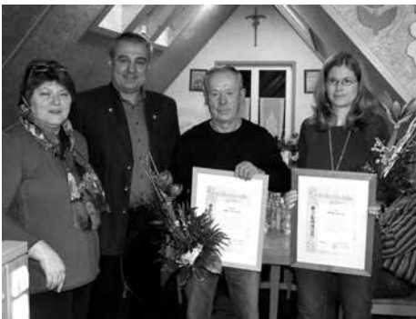
Jahreshauptversammlung mit Ehrungen Obst- und Gartenbauverein Pfaffendorf