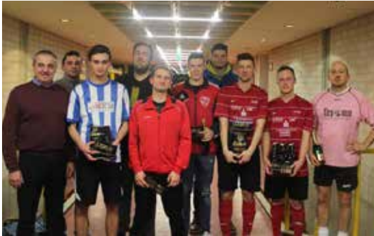
Hallenturnier 1. FC Woffendorf