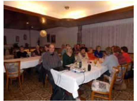
Jahreshauptversammlung Obst- und Gartenbauverein Baiersdorf