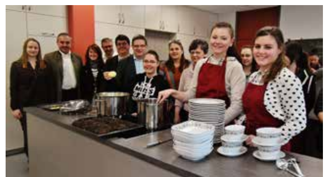
Neue Schulküche in der Mittelschule