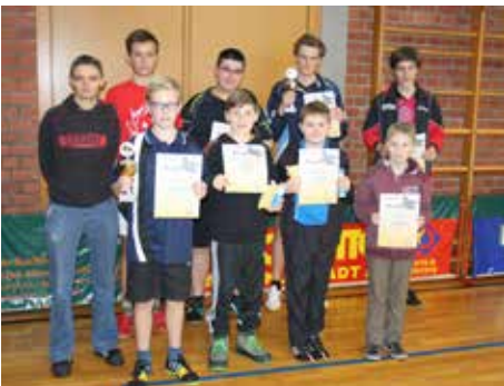
Kreisranglistenturnier des TTV 45 Altenkunstadt Jugend/Schüler B