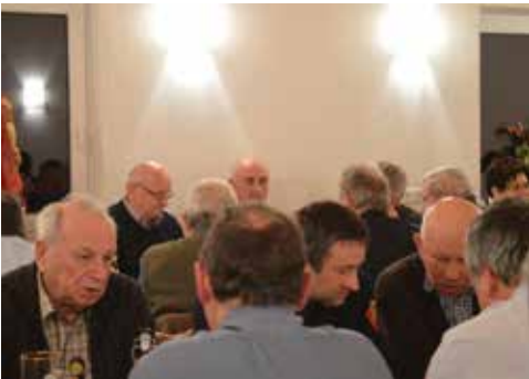
Jahreshauptversammlung FFW Maineck