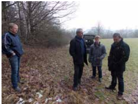
Standortsuche Funkmast mit Vertretern der Telekom