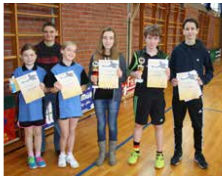
Schülerinnen und Schüler A