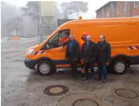
Neues Fahrzeug für den Bauhof