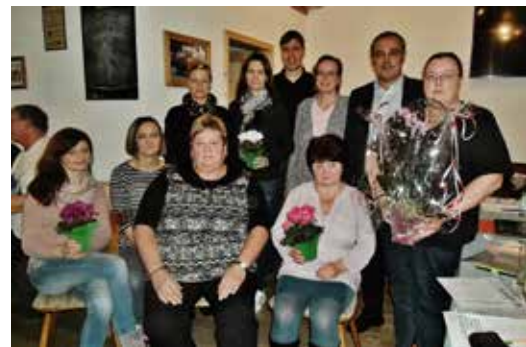
Ehrungen und Neuwahlen Obst- und Gartenbauverein Spiesberg