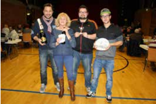
Preis-Bierkopf 2016 des TTV45 Altenkunstadt