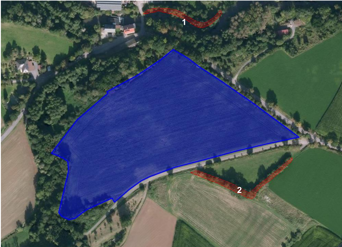
Abbildung 4 - Angrenzende kartierte Biotope

Direkt an das Vorhabengebiet grenzen zwei kartierte Biotope an.