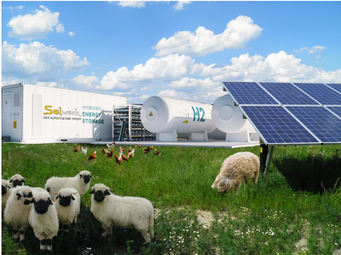
Abbildung 2 - Sinnbild Agrovoltaik

Wie viele andere Branchen steht auch die Landwirtschaft vor der Herausforderung ihren Platz im 21. Jahrhundert zu finden und auch der nachfolgenden Generation noch eine Perspektive bieten zu können.